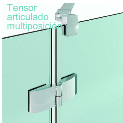
Tensor articulado multiposición