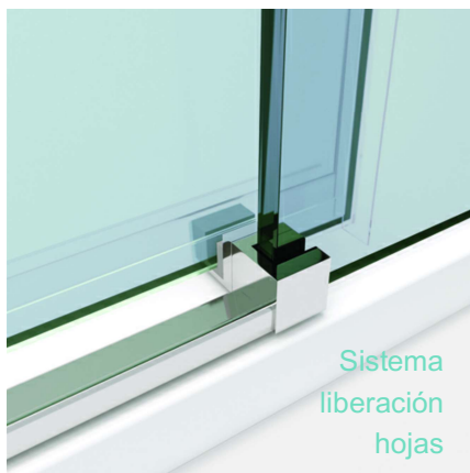
Sistema liberación hojas