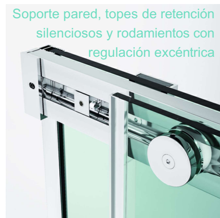
Soporte pared, toques de retención silenciosos y rodillos con regulación excéntrica